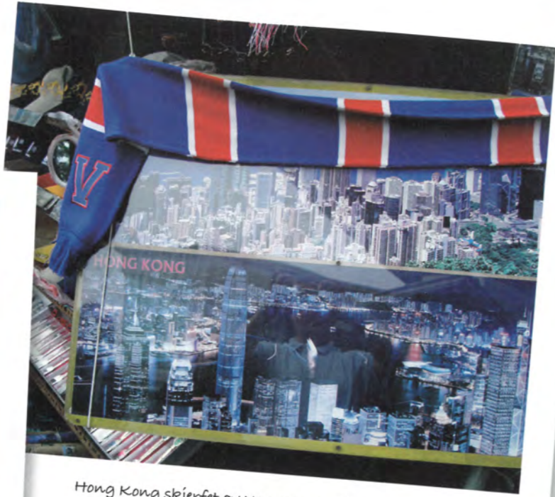
Hong Kong skjerfet av Kenneth Zetlitz