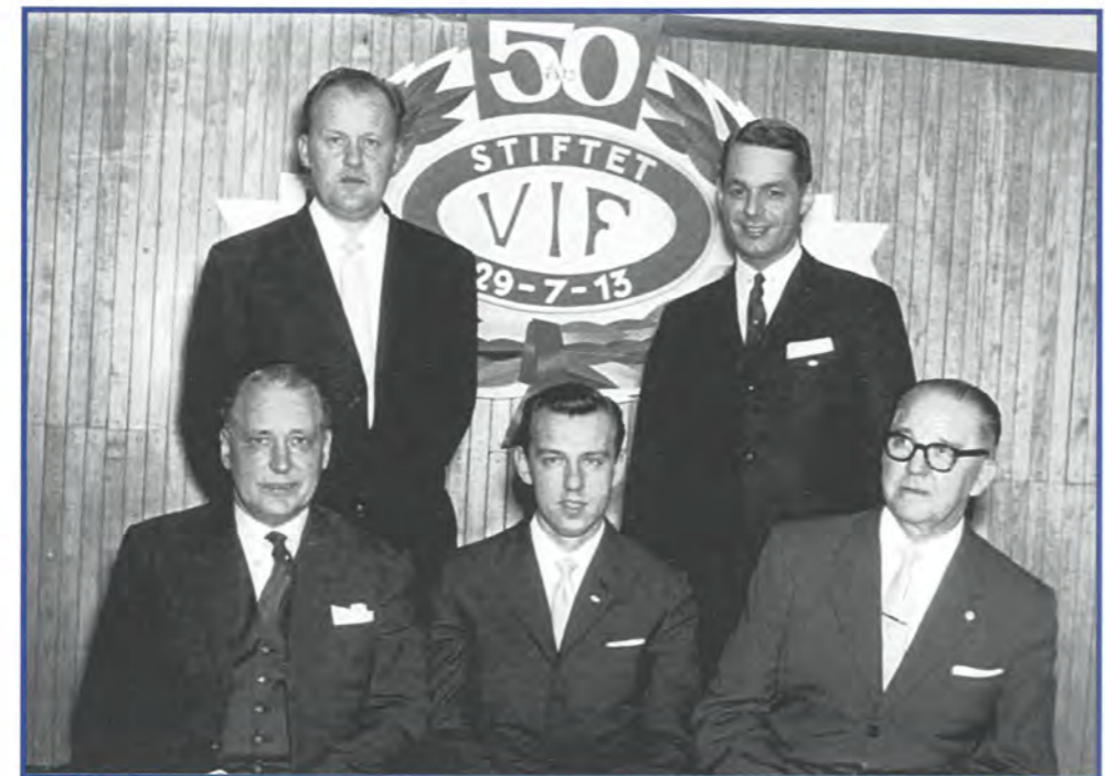
Vålerengas styre i jubileumsåret 1963.