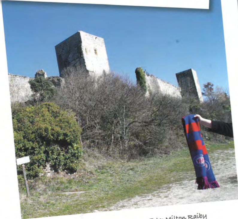
Chateau Cathare de Puiver.