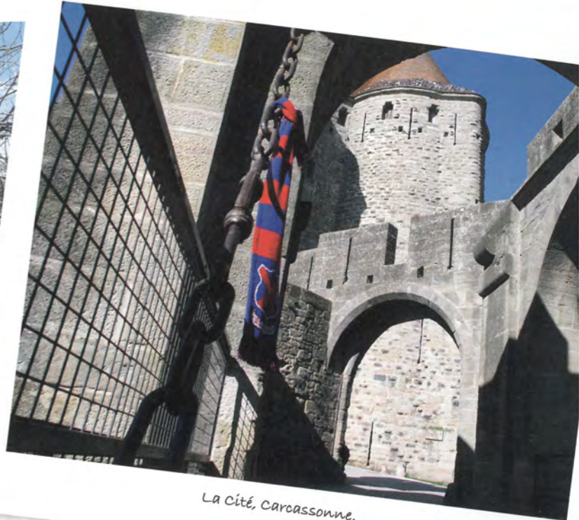
La Cité, Carcassonne