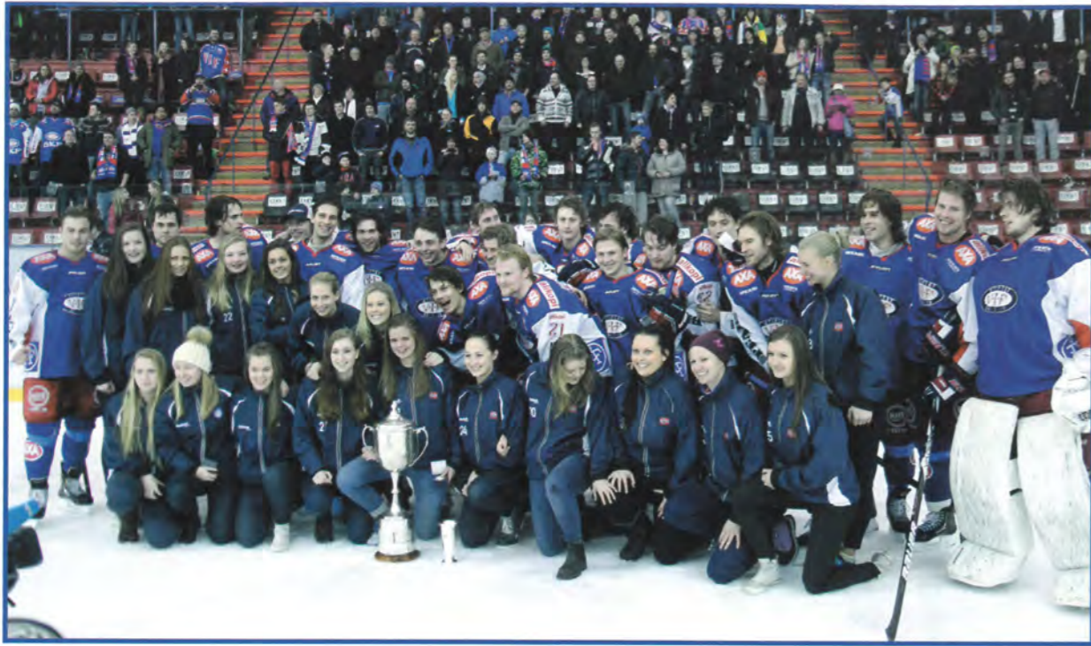
← Välerengas hockeydamelag tapte kun ett poeng i årets seriespill. Her sammen med det serievinnende herrelaget.