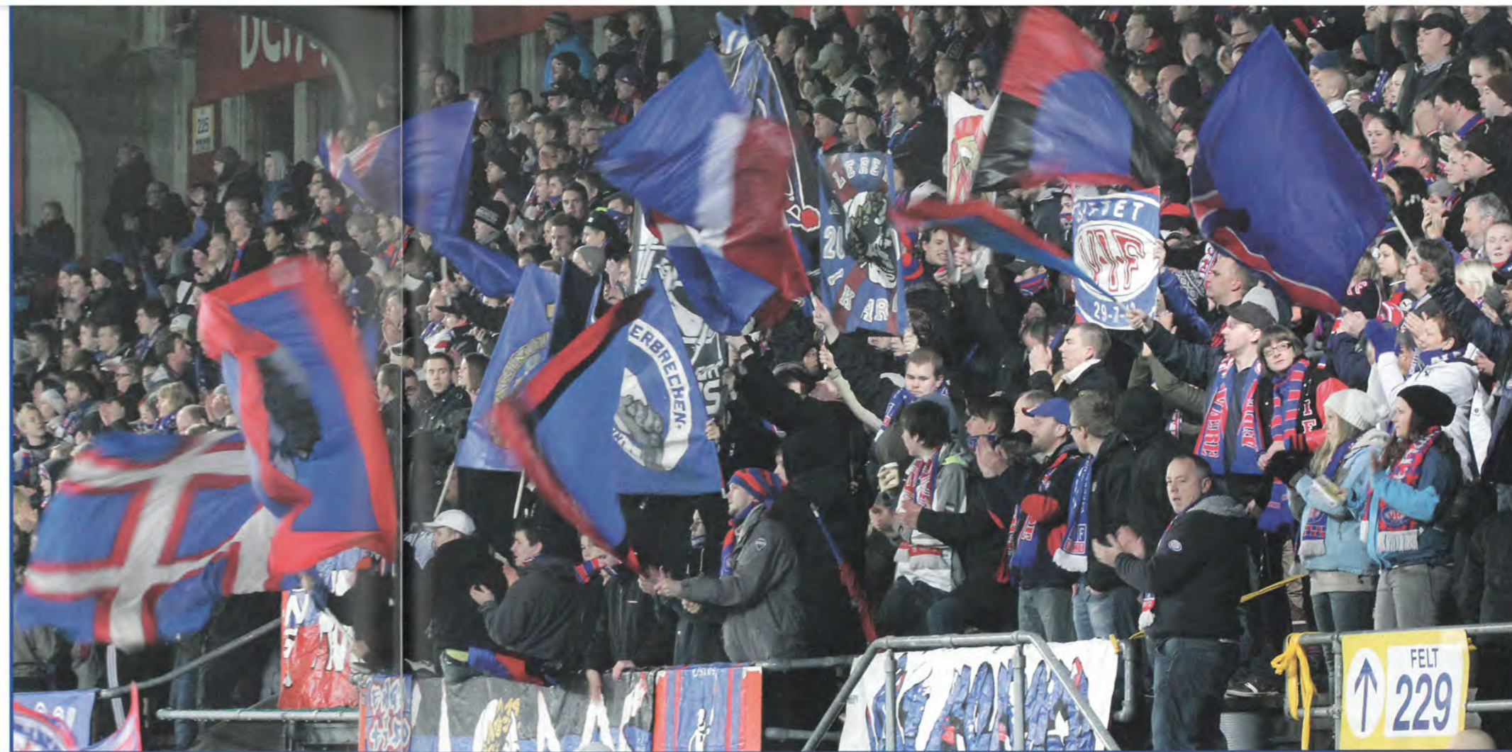
↑ Alle må finne sin plass på tribunen, mener artikkelforfatteren.

Det er mange ting som kan og bør bli bedre og her må vi høre på alt fra gamle grinebitere til sinna unge menn. En ting som er helt sikkert og det er at det ikke hjelper å kjefta på hverandre og her er det mange som bør gå i seg sjæl. Fokus skal være på kamp og sang og ikke hva alle andre gjør eller ikke gjør. Å finne sin plass på tribunen er et stikkord her og det er lettere hjemme enn borte. Hjemme veit de fleste hvor de hører hjemme men borte er det mye kokkos. Mye grunnet dårlige tribuner men også inntak av rus og en jeg-har-rett hold-