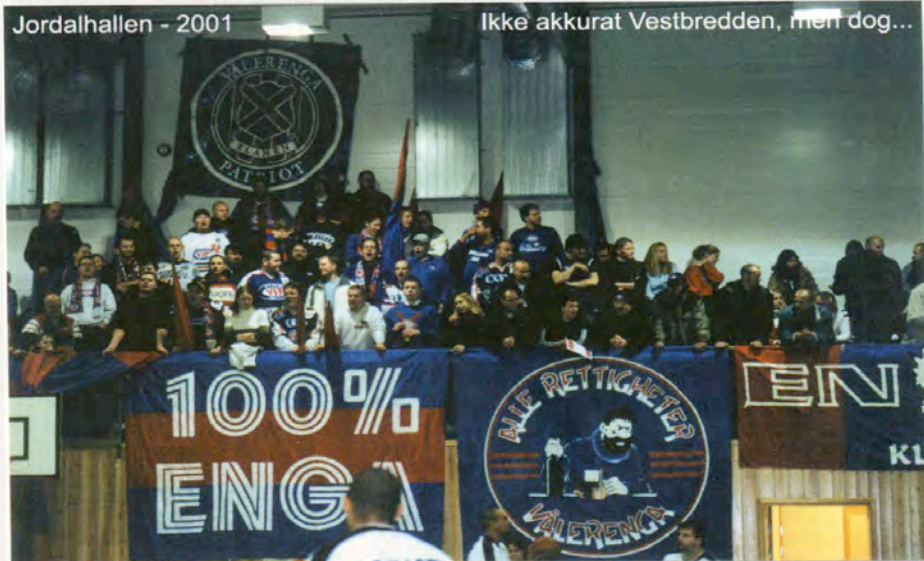
Jordalhallen - 2001