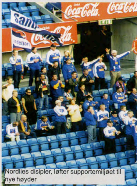
Nordlies disipler, løfter supportermiljøet til nye høyder

Det er som faen! Det er like sikkert som at vi ikke vinner eliteserien i år! Etter hver eneste kamp - både hjemme og borte - dukker det opp diverse vannisser og hagegnomer på Klanens og VPns debattforumer med hjerteskjærende oppgulp og betraktninger om hvor patetisk dårlige vi var på tribunen etc. etc. mm. osv. osv. Fakta faen er at folk som tar på seg denna holdninga er totalt hjernedøde! Jada, selvfølgelig har vi bølgedaler vi også - men vi suuger aldri på tribunen! Alle som mener det burde tapes fast sammen med medgangsupportera på hovedtribunen og faktisk få oppleve trøkket som ikke er fraværende en eneste jævla kamp! Deretter burde de tvinges til å krabbe over gressmatta og be om unnskyldning for å ha tatt så jævla feil! Jeg er faktisk drittlei all sytinga! Hva om folk ENGAs-