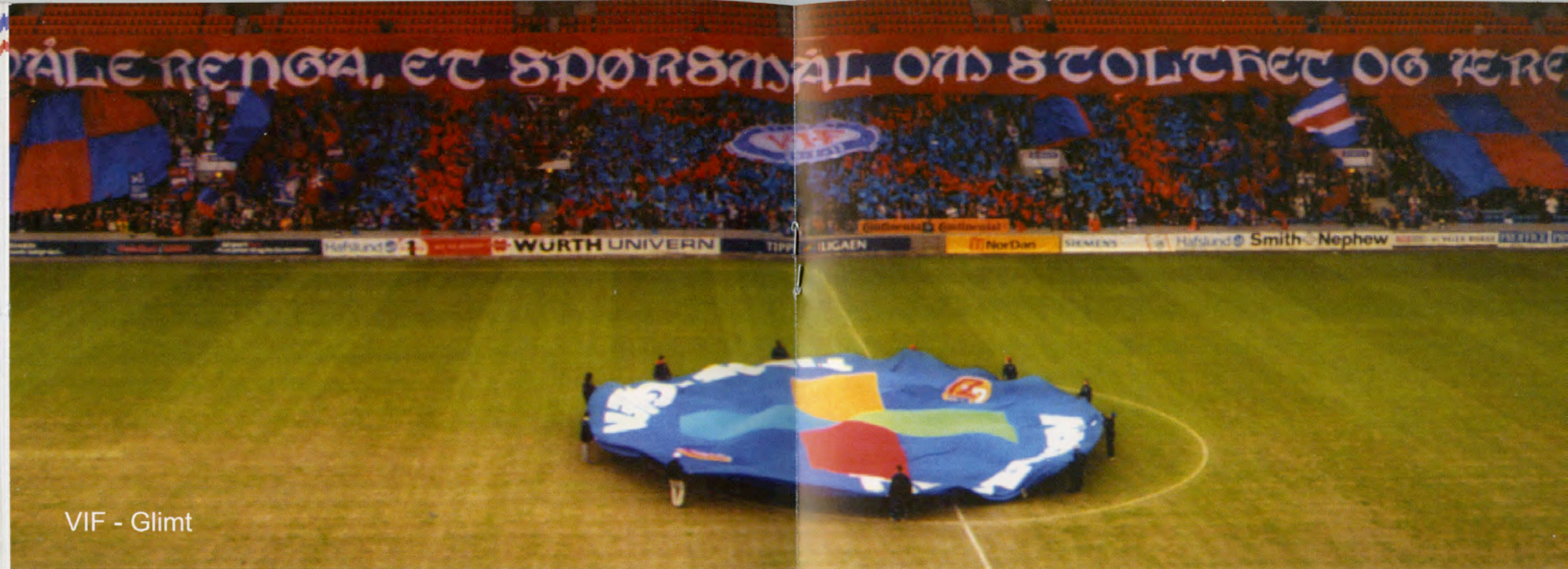
VIF - Glimt