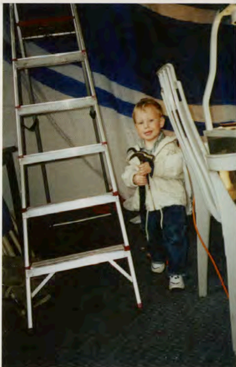
Gjennomsnittsalderen i EngaTifo er ikke så høy som mange vil ha det til.

Hvor mange timer vi har brukt på dette er en bedriftshemmelighet, men det er flere en dere tror. Helt på tampen ønsker vi i EngaTifo å takke alle som har hjulpet til på dugnadskveldene våre, alle støttespillere som trår til når vi ber om hjelp og sist men ikke minst, alle medlemmene i Klanen som er med på å gjøre våre tifo til noe klubben og dens supportere kan være